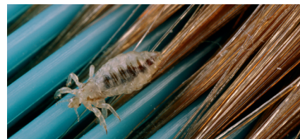
Hoofdluis op een kam.